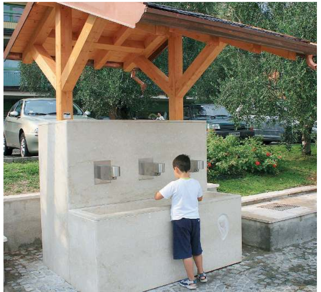
Punti acqua. L'anno passato, causa Covid, i rubinetti sono rimasti chiusi da marzo a luglio