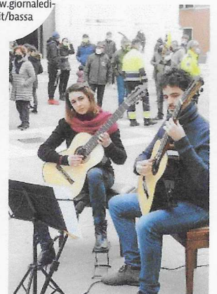
Musica. È stata una festa per tutti