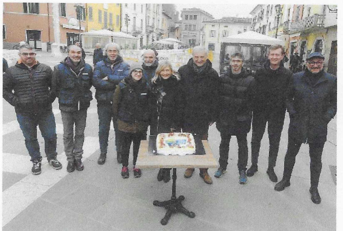
Dietro le quinte. Ieri è andata in scena la puntata numero 200 di «In Piazza con Noi», una festa per tutto il cast