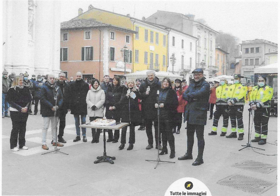
Davanti alle telecamere. Un momento della trasmissione