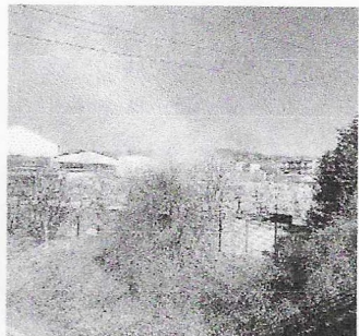
Allarme. Il vento ha spinto il fumo verso Borgosotto

anche al vaglio degli inquirenti: «Le cause e l'origine delle fiamme rimangono per ora sconosciute - ha spiegato Togni -. Maggiori approfondimenti saranno fatti dalle forze dell'ordine anche grazie ai filmati delle telecamere di sorveglianza».