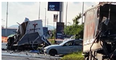
Lo schianto costato la vita al ragazzo Messineo e Pari pag.31